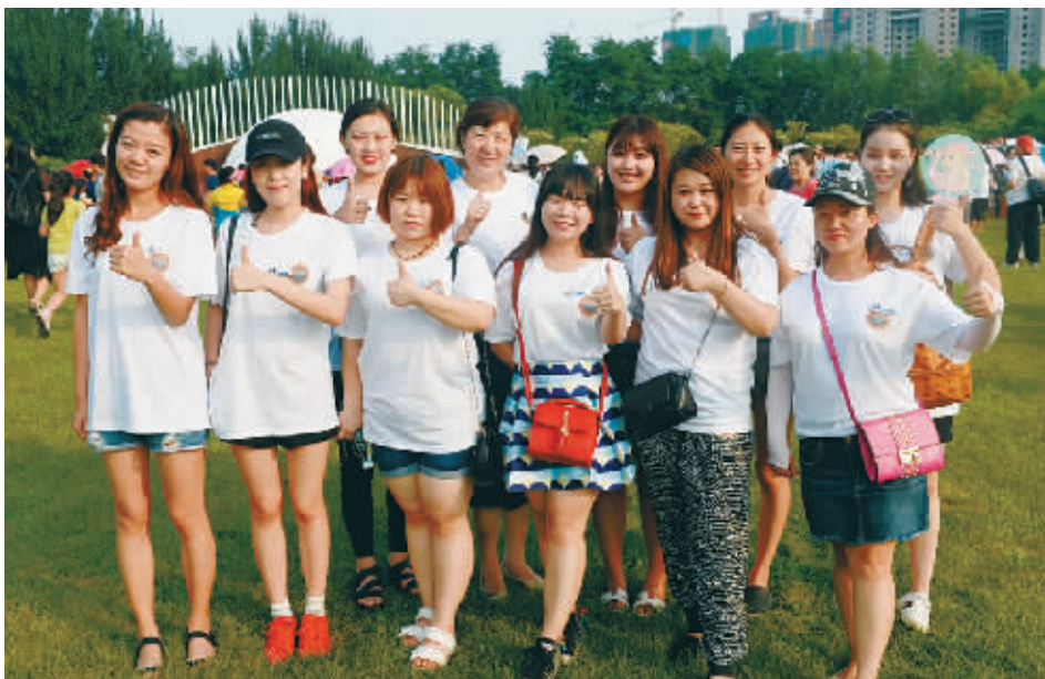
朗朗钢琴广场的志愿者们

另外,为了给观众提供细致、周到的服务,50名志愿者在现场维持秩序,还向大家科普钢琴音乐知识,他们的身影成为朗朗钢琴广场上一道亮丽的风景线。