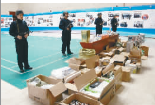
▲沈阳警方通过公安改革大大提升打击违法犯罪效能

那么，过去派出所承担的打击违法犯罪职能谁来接手？一系列措施由此推出。谁都知道，侦查破案是刑警天职，但随着时间推移，中国上世纪九十年代随着社会警务工作错综复杂，面对警力不足的情况下，基层派出所开始承担刑事侦查工作。但随着社会发展的变迁，冲在侦查破