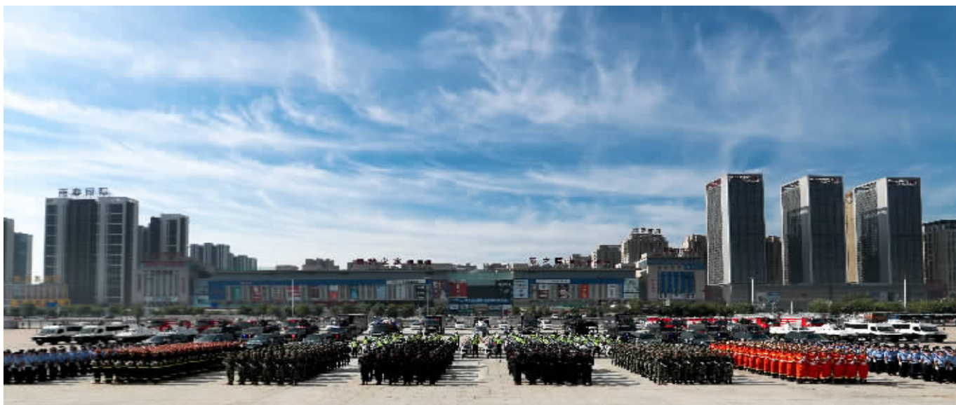
沈阳公安在派出所及大警种警务改革中硕果累累

同样还是这座城市，同样还是这支队伍，三个多月过去了，成效立竿见影。是什么促使沈阳市的公安工作发生了巨大的变化？是什么让沈城的治安状况得到了改善？经过多日调查采访，可以梳理出答案：是制度改革产生的动力，是科技强警带来的效率，是观念和思维方式的改变，是管理思想、模式和工作机制的转变带来的嬗变！