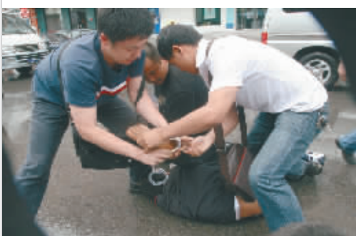
▲沈阳警方多警种合并重拳打击违法犯罪行为