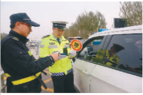
▲沈阳警方开展治安巡逻大防控活动

东北经济复苏，经济增速加快。沈阳公安通过警务改革，为城市发展筑牢平安基石，提升对区域发展的贡献率。