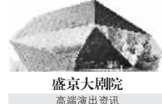
盛京大剧院 高端演出资讯

5年来,沈阳交响乐团开展惠民演出百余场,广场上、学校里,都能看到他们演出的画面。为了将高雅音乐更好地普及,沈阳交响乐团还开展新形式演出,举办“视频、讲解”音乐会。