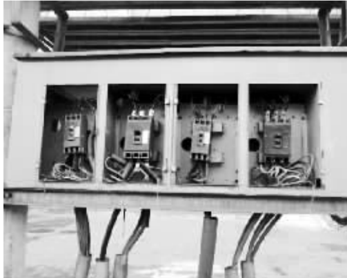
▲2月8日，笔者途经辽中县西转盘至辽中县第二高级中学不到二百米的路边人行道上发现，沿路的变压器下电控箱电线都裸露在外面，几个电控箱的门都没有了。