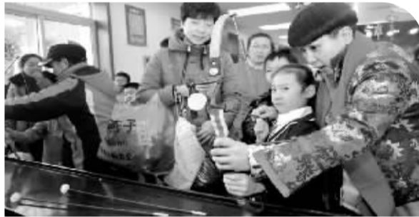
吹糖人、画灯笼、写春联……2月11日，沈河区少年宫举办娃娃庙会，学生和家被传统的民间艺术深深吸引，浓浓的年味儿让孩子们过了个有意义的寒假。